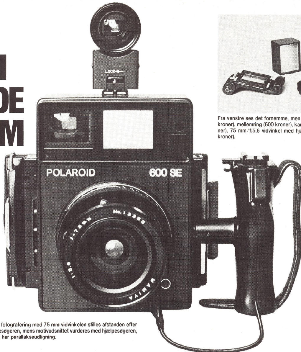
Ved fotografering med 75 mm vidvinkelen stilles afstanden efter målesøgeren, mens motivudsnittet vurderes med hjælpesøgeren, som har parallakseudligning.

man kan skifte filmtype under fotograferingen.